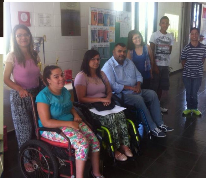
SESI – Santa do Parnaíba