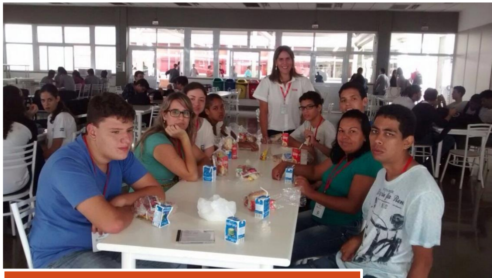
SENAI de Sertãozinho