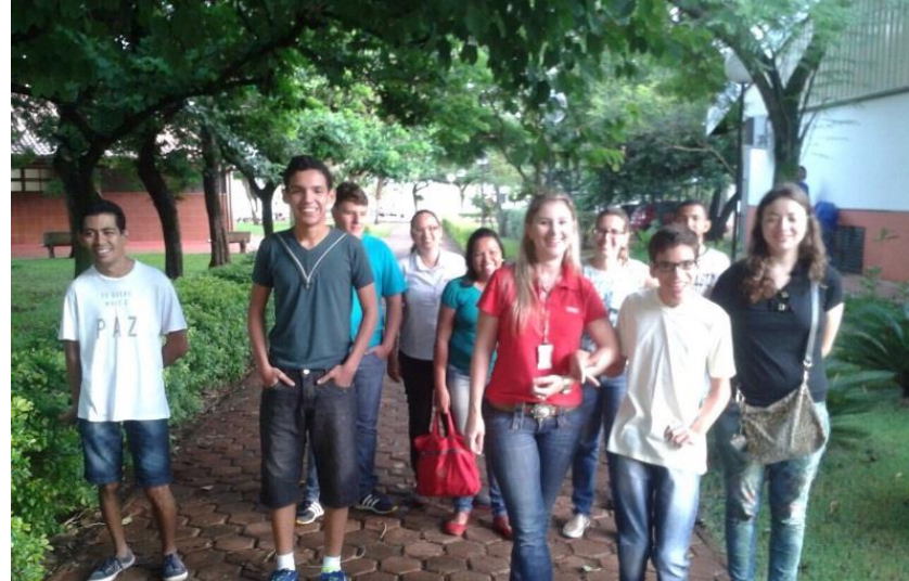
SESI de Sertãozinho