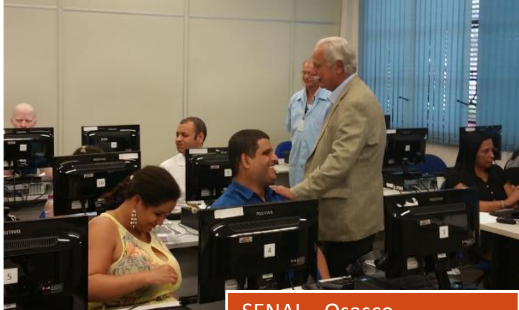
SENAI – Osasco

Turma de Osasco teve início em 2/2 BASF / CHIESI / ENGRECON