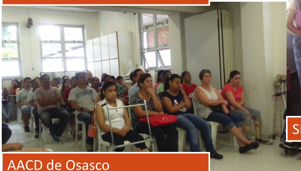
AACD de Osasco